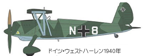
ドイツ・ウェストハーレン1940年 10/JG72 N+8