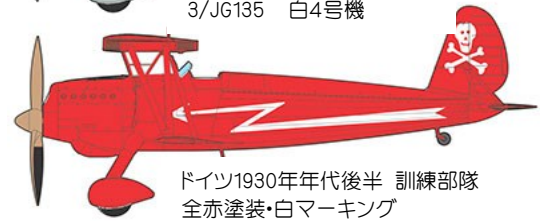
ドイツ1930年代後半 訓練部隊 全赤塗装・白マーキング