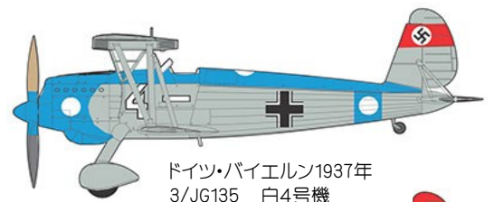
ドイツ・バイエルン1937年 3/JG135 白4号機