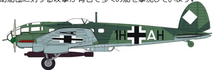
マーキングは第26爆撃航空団第1飛行隊(1/KG26)です。

1930年代に将来高速爆撃機としての性能を持つ事を目的として民間旅客機として開発されました。ベルサイユ条約の破棄後は公然と爆撃機として生産され大戦を通じて運用されました。H型はP型から採用された全視界型と呼ばれる一体型の風防に変更されています。また主翼はF型より採用されたテーパー翼でより量産に適していました。H型は最も生産されたタイプでH-6は魚雷搭載可能となっています。特に北海での対ソ援助船団に対する攻撃が有名で多くの船を撃沈しています。