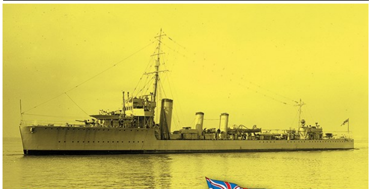
CS70632 英・嚮導駆逐艦アンザック・Eパー ツ付き・1917

全長99m・排水量1660トン・三軸蒸気タービン・速力34ノットQF4インチMk.IV砲4門・2ポンドMk.II砲2基・533mm連装魚雷発射管2基。1915年バーゲンヘッド造船所で着工。1916年就役。1916年第11駆逐隊に配属。1917年大規模な北海でのUボート狩り作戦に参加。1918年スカパフローに回航されるドイツ艦隊を監視。1919年第21駆逐隊に配属。1919年予備役。1924年艦隊配備。1930年解体。