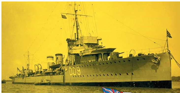
CS70631 英・嚮導駆逐艦シーモア・Eパーツ 付き・1916

全長99m・排水量1440トン・三軸蒸気タービン・速力34ノットQF4インチMk.IV砲4門・2ポンドMk.II砲2基・533mm連装魚雷発射管2基。1914年ニューキャッスル・アボンタイン造船所で着工。1915年就役。1916年第12駆逐隊にてユトランド沖海戦参加。1917年第6駆逐隊に移動。戦争終結まで北方パトロール任務に従事。1919年除籍。1921年解体。