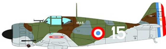
1940年6月 シャトールー No622号機