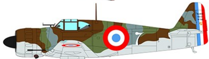
1940年6月 セーヌ・エ・マルヌ No528号機