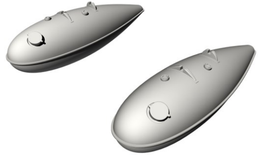
1/32 32CM5128 米・P-51Dムスタング・ドロップタンク2個・レベル