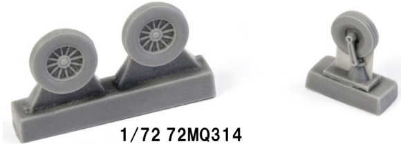
1/72 72MQ314 米・A-4スカイホーク用初期型主車輪&前輪・エアフィクス