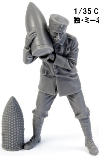
1/35 CMF35342 独・ミーネンベルファー弾薬手・WW1