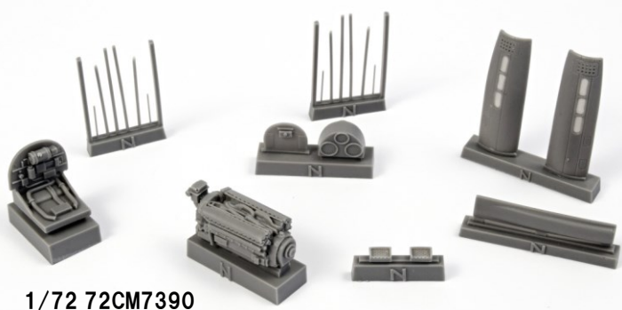
1/72 72CM7390 米・カーチスP-40N用エンジンセット・スペシャルホビー