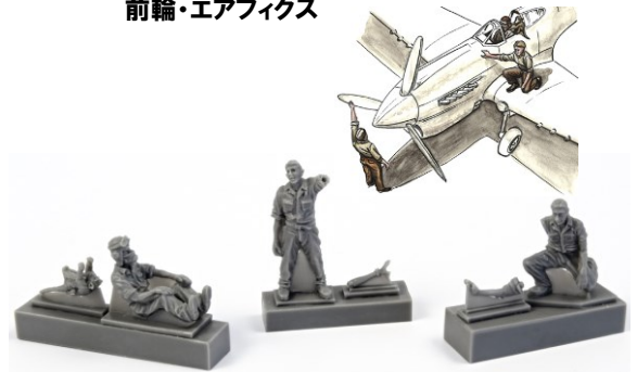
1/72 CMF72344 英・P-40パイロット&整備兵3体北アフリカ戦