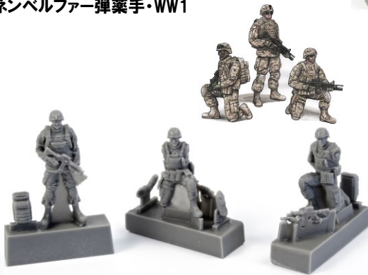
1/72 CMF72343 米・第2師団兵士3体・現用