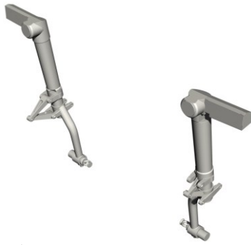
1/32 32CM5123 米・P-51Dムスタング・主脚柱・レベル

★一部輸入品の為入荷が遅れる場合がございます。ご了承下さい。在庫品は随時出荷いたします。詳細は小社ホームページにてご紹介しています。