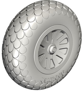
1/32 32CM5124 米・P-51Dムスタング・楕円パター

★一部輸入品の為入荷が遅れる場合がございます。ご了承下さい。在庫品は随時出荷いたします。詳細は小社ホームページにてご紹介しています。