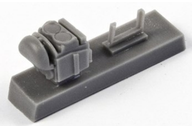
1/32 32CMQ318 米・P-51Dムスタング・K-14A照準 機・レベル