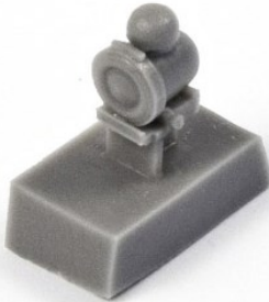
1/32 32CMQ319 米・P-51Dムスタング・N-9 照準機・レベル