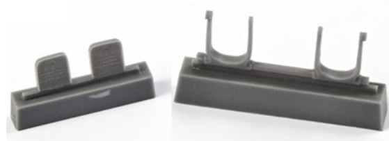
1/32 32CMQ317 米・P-51Dムスタング・ラダーペダル・レベル