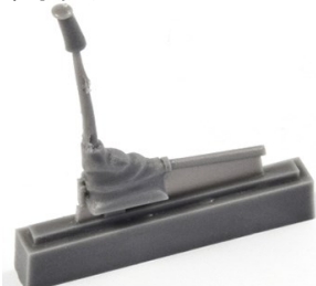
1/32 32CMQ316 米・P-51Dムスタング・操縦 桿・レベル