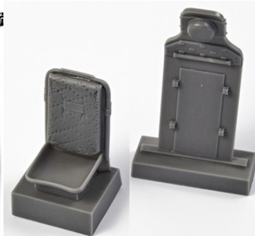
1/32 32CMQ320 米・P-51Dムスタング・ハーネス無 シート&防弾版・レベル