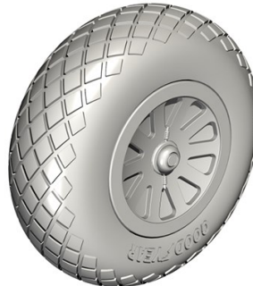
1/32 32CM5126 米・P-51Dムスタング・菱形パ ターンタイヤ・レベル