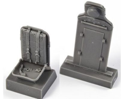
1/32 32CMQ321 米・P-51Dムスタング・ハーネス付 シート&防弾版・レベル