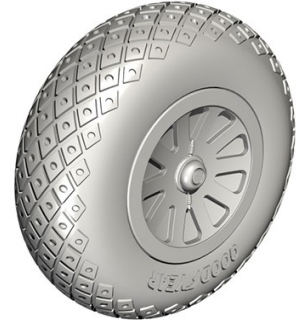
1/32 32CM5127 米・P-51Dムスタング・菱形穴開