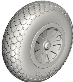
1/32 32CM5125 米・P-51Dムスタング・十字パ ターンタイヤ・レベル