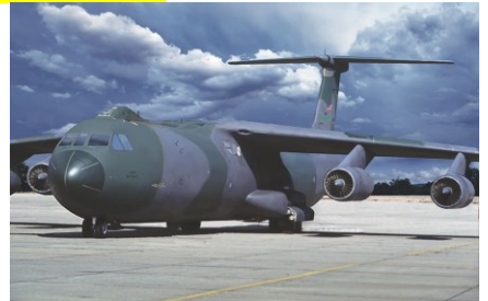
014T331のボックスアート