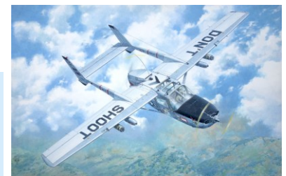
032T620のボックスアート

セスナ社の民間型タイプ337をベースに開発された軽量双発機です。エンジンは胴体の前後に装備され尾翼は双ブームで支えられています。ベトナム戦争時には目標指示任務や主翼下に装備したロケット弾でのCOIN任務などに使用された。また救難任務にも多用されていました。現在は米軍での使用は終了していますが民間や海外の軍などで今なお人気で多用されています。