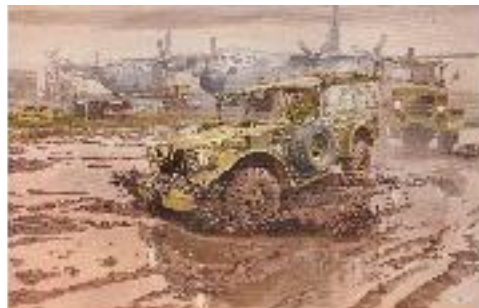
035T809のボックスアート