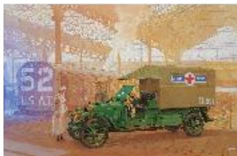
072T717のボックスアート